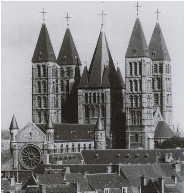
Tournai Cathedral, Belgium, 1171-1213