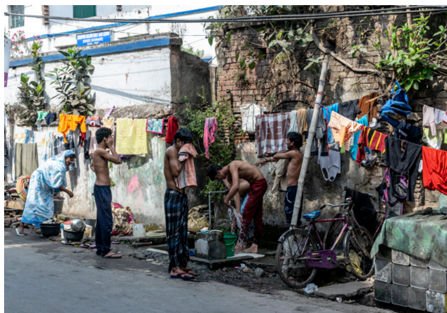
Vandposten Fotografi 2019