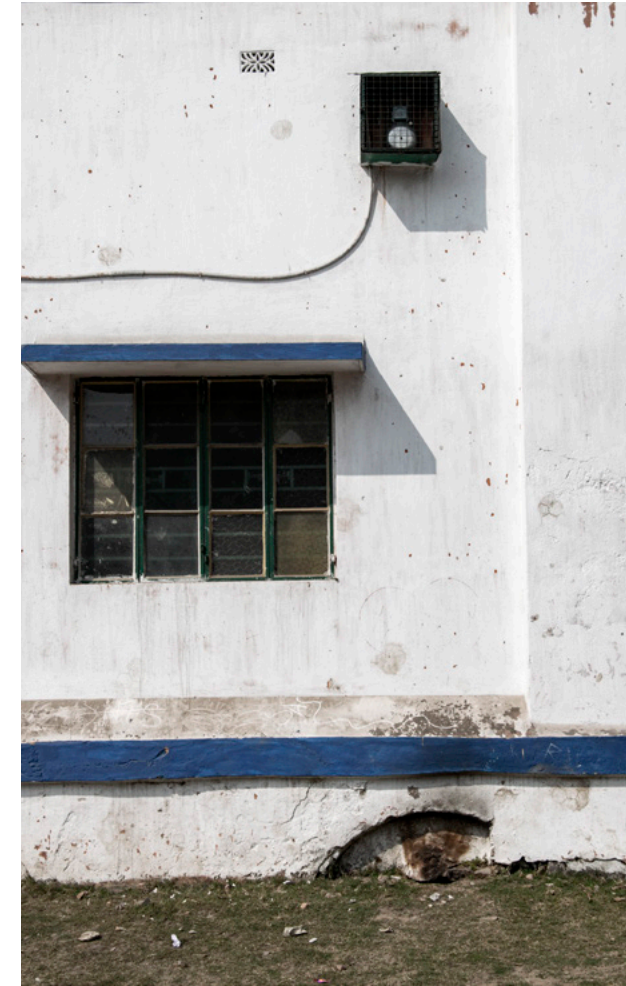
Serampore Missions Girls' High School Fotografi, 2019