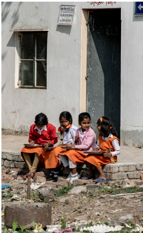
Mid day meal, scheme Fotografi 2019