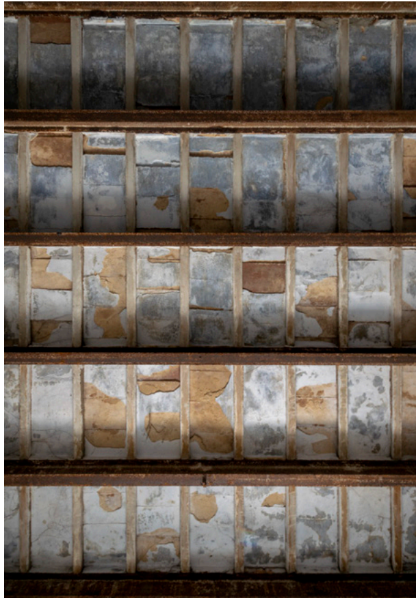
Hannah House Fotografi 2019