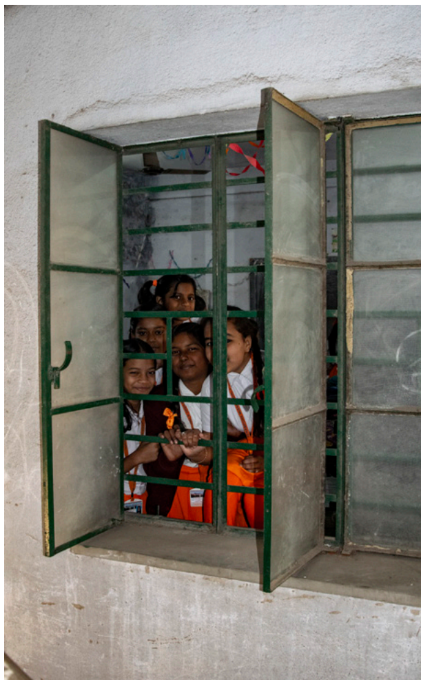
Piger kigger med Fotografi 2019

værende regering, der ønsker bedre rammer for uddannelse, hvilket tyder på en åbenhed for at støtte eleverne i deres skolegang.