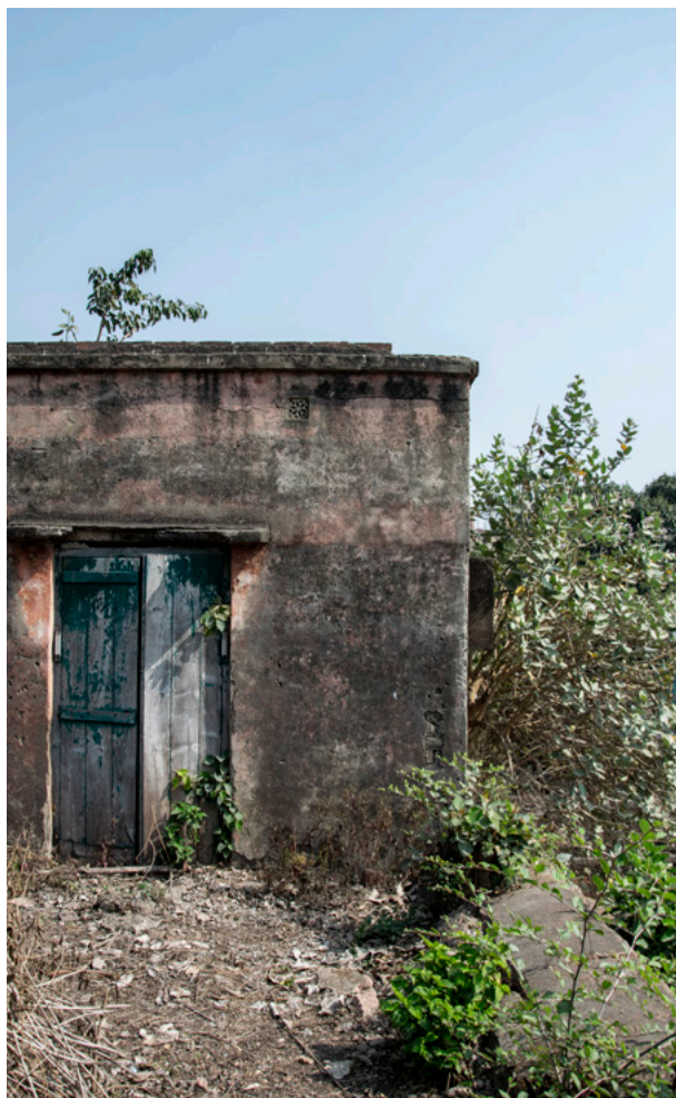
Hannah House Fotografi 2019