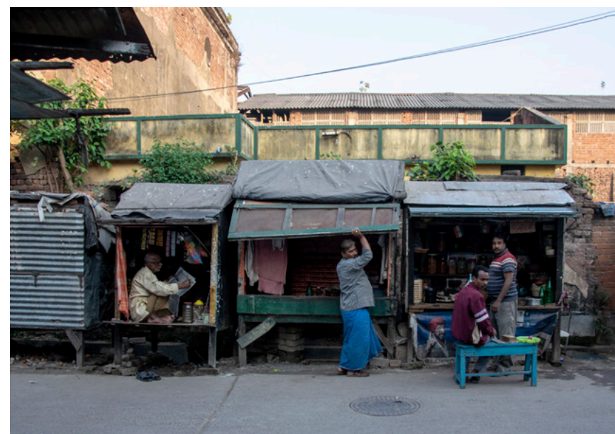
Handel Fotografi 2019