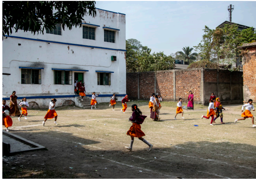
Serampore Missions Girls' High School Fotografi, 2019