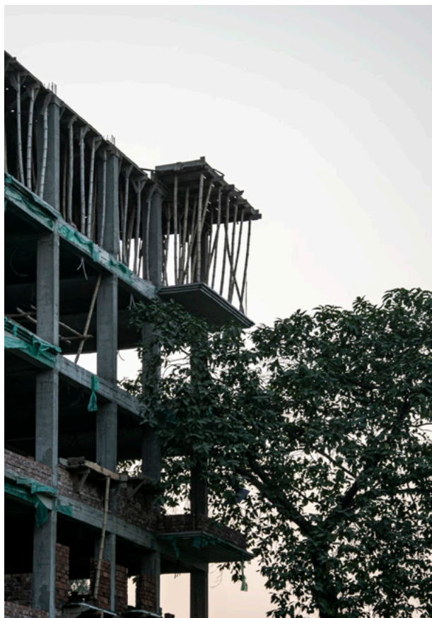
Moderne byggeri Fotografi 2019