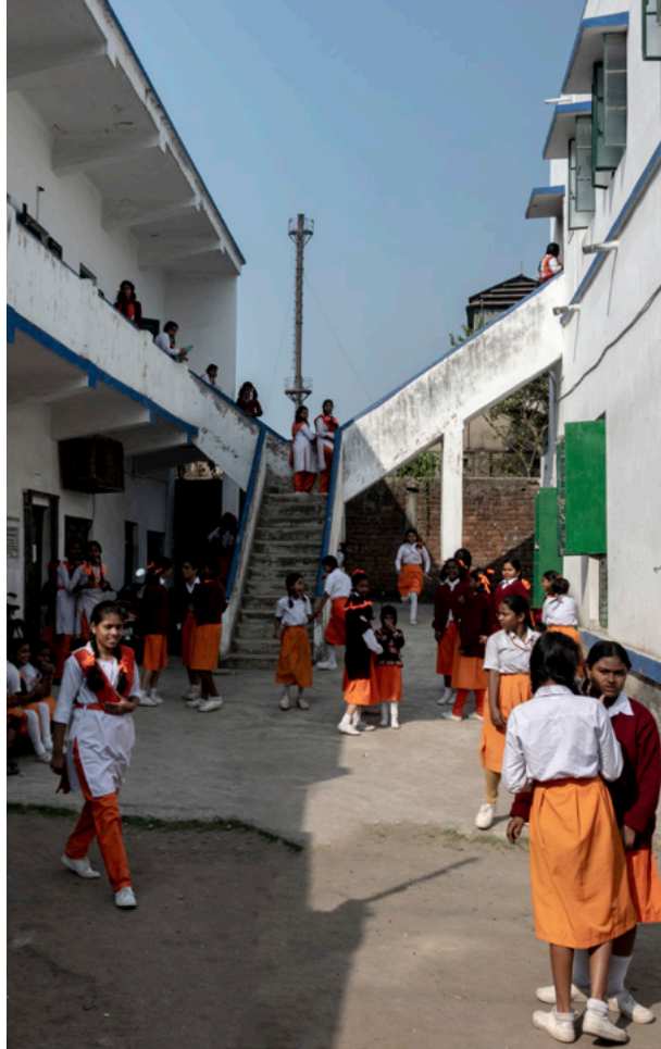
Skolegården Fotografi, 2019