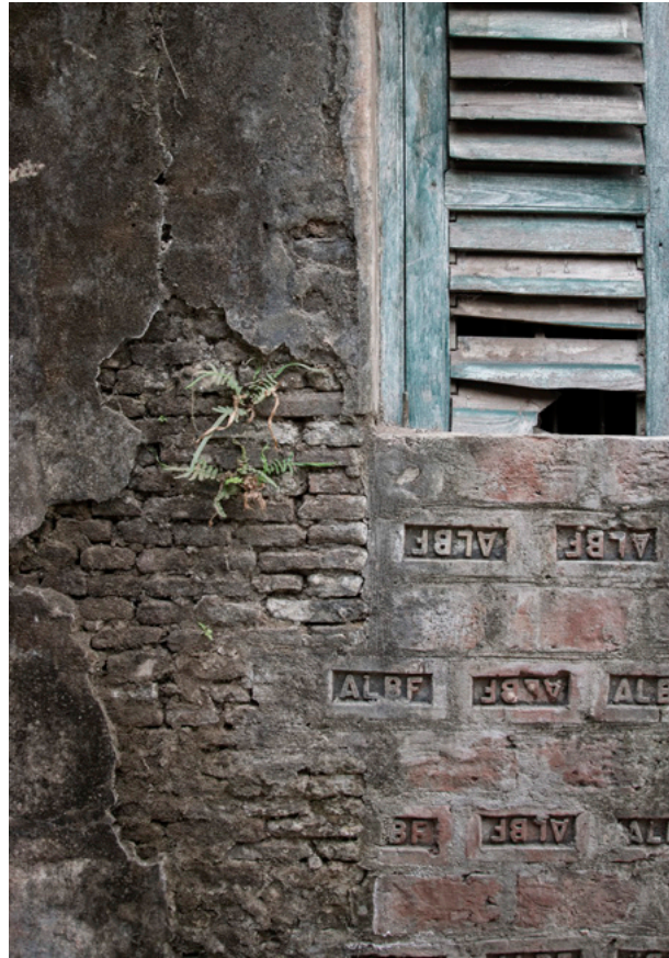
Hannah House Fotografi 2019