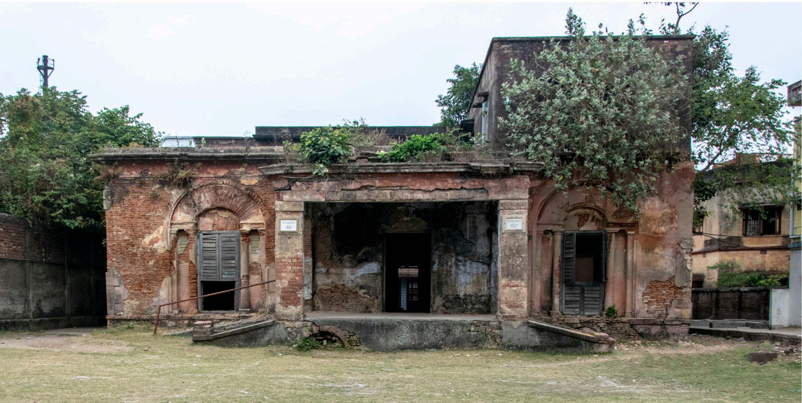
Hannah House Fotografi, 2019