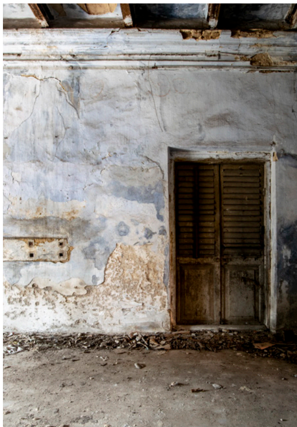
Hannah House Fotografi 2019