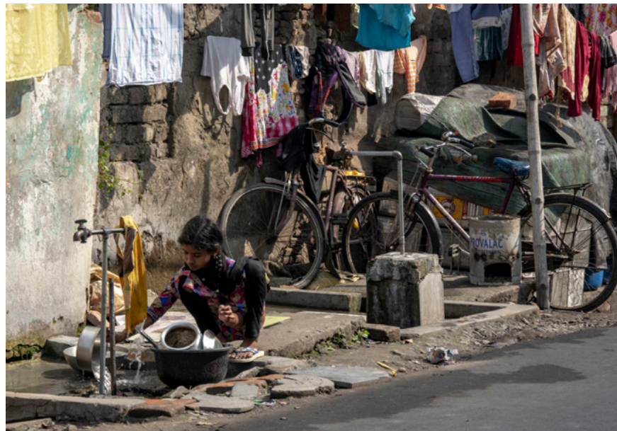
Pige der vasker op i gaden Fotografi 2019