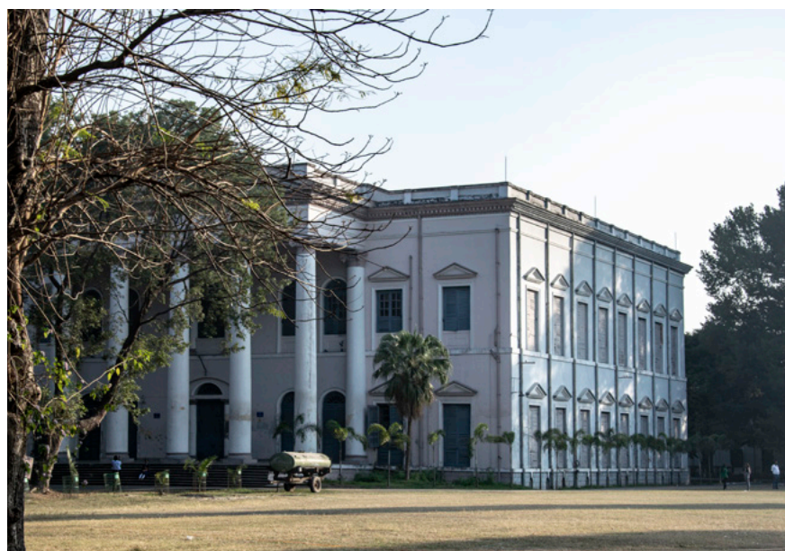
Serampore College Fotografi, 2019