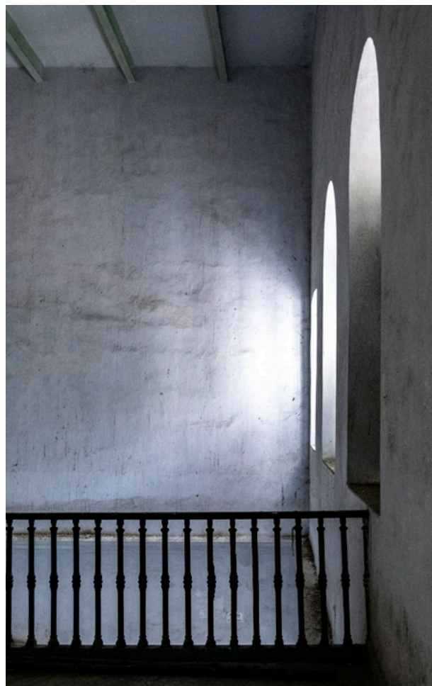
Serampore College Fotografi, 2019

Som følge af regningsskiftet og de større socialreformer blev muligheden for oprettelsen af pigeskoler åbnet. I Culcutta startede organisationen "The female Juvenile Society for the establishment and support of Bengali Female Schools". Culcutta var den første by, der oprettede pigeskoler i Bengal. Skolernes navne blev brugt til at hædre en familie eller kirke, som aktivt støttede skolen, men selve undervisningen og uddannelsesformen kan spores tilbage til Hannah Marshman. Familien Marshman åbnede i 1821 deres første pigeskole i Serampore, og i perioden frem til 1828 stod de for etableringen af 33 skoler i hele den nordlige og centrale del af Indien.