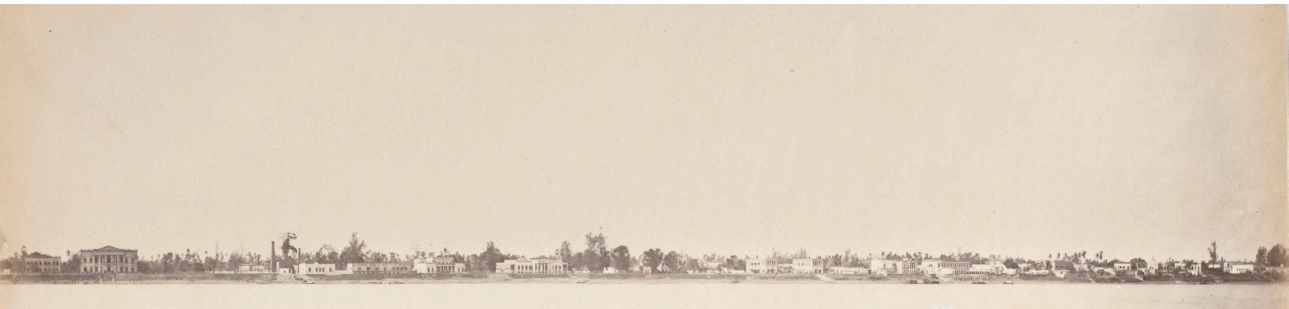
Fotografi fra Barrackpur over Serampore Fotografi fra 1861