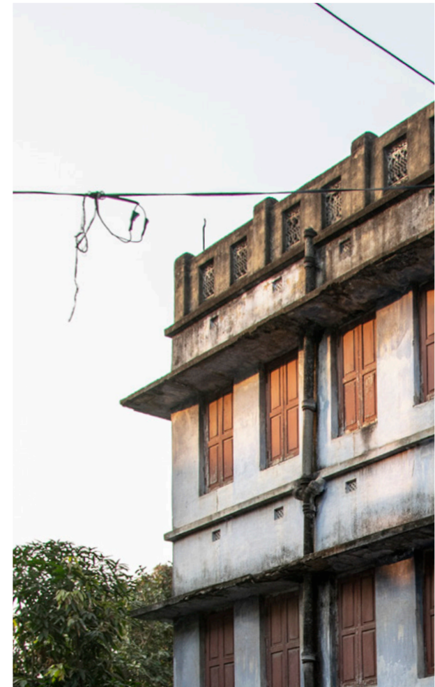
Serampore Fotografi 2019