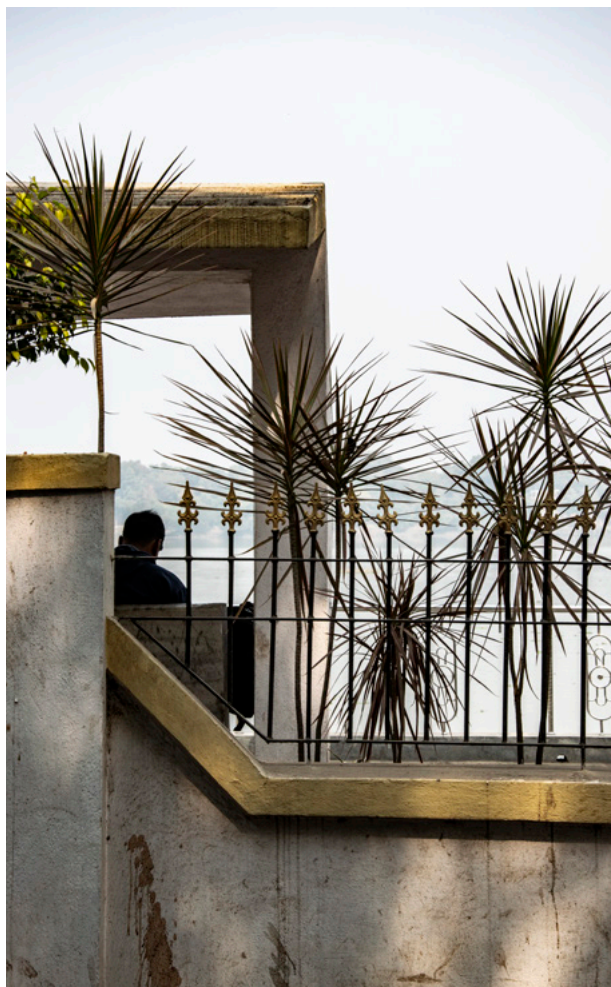
Udvikling, fornyelse Fotografi 2019