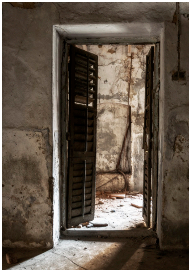
Hannah House Fotografi 2019