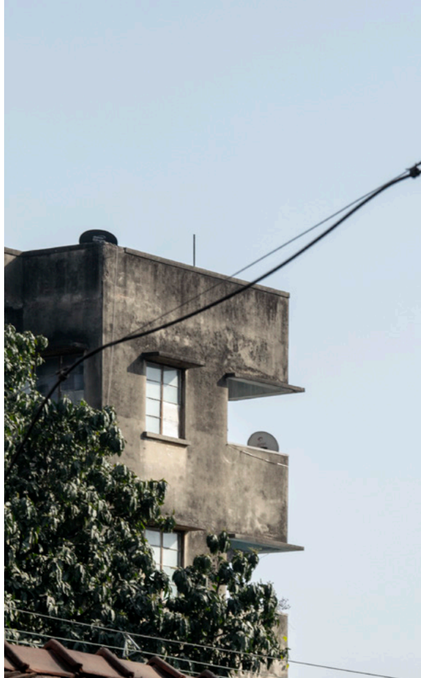
Serampore Fotografi 2019